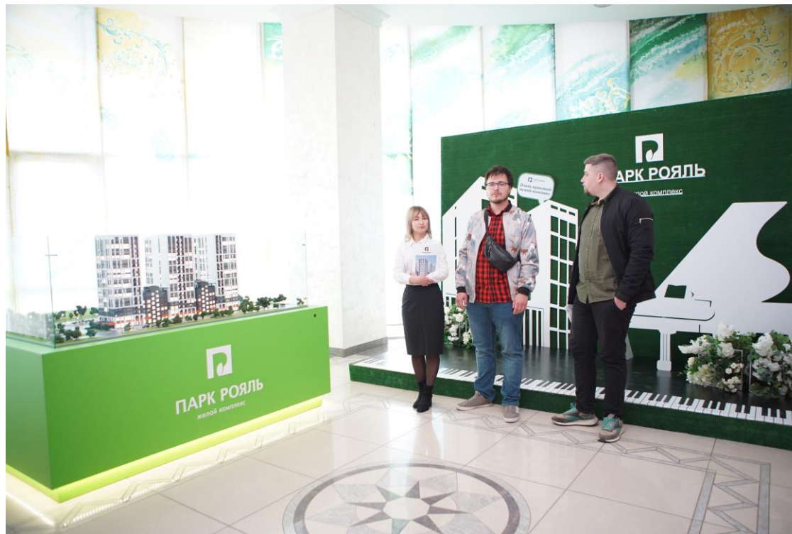
ООО «Термодом» – генеральный партнер Форума «Мой бизнес-2022. Время перемен» (размещение гранд-макета проекта и фотозоны)