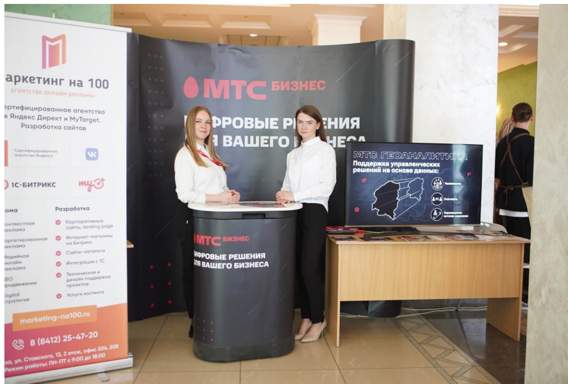
Компания МТС – партнер Форума «Мой бизнес-2022. Время перемен» (размещение поп-апа, стол для информационных брошюр)